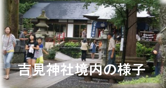
吉見神社境内の様子

昭和50年 高森と高千穂つなぐトンネル工事中に大量湧水で工事を中止した。推量毎分30数トン現在は高森町の重要な水源地 ・トンネル内ではいろんな行事が開催されている。